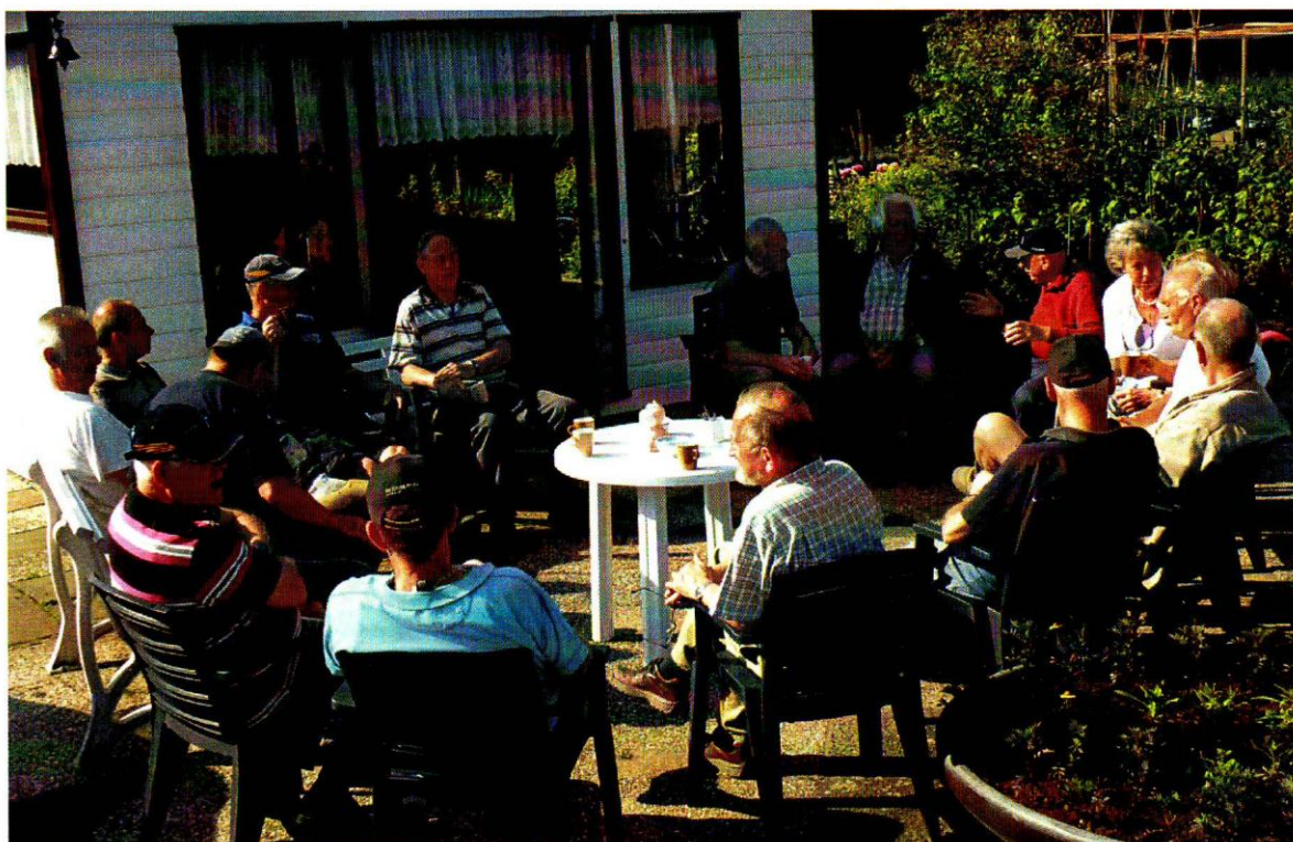
Het koffie drinken op een mooie zaterdagmorgen